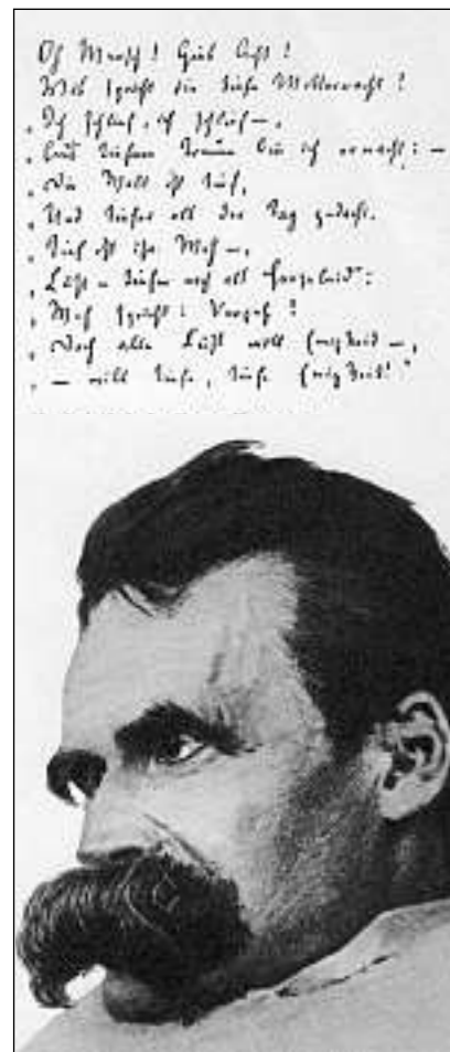
Manuscrip da l'enconuscent chant da Zarathustra.

Nietzsche conceda «quest eveniment sez», il fatg che Dieu è mort, saja «bler memia grond, memia lontan, memia lunsch davent da la capacitad da chapir da bliers per dir che insumma mo sia nova saja gia arrivada: nundir che bliers savessan gia tge ch'è atgnamain succedì – e tge tut che sto ussa sbalunar suenter che questa cretta è sutminada, perquai che tut era construi sin quella, basava sin quella, era creschì en quella: per exempel nosa entira morala europeica.» Qua cumenza gia quai che fa tema, la gronda snavor da la diagnosa.