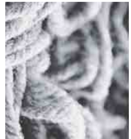
... launa nursa sun ils elements dal teppi grischun