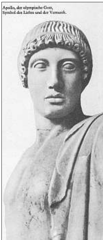
Apollu, il dieu olimpico – simbol da glisch e raziunalitad.

La vita exteriura da Nietzsche fa l'emprim ina parita malsanitscha e finescha la finala en ina malsogna che na guarescha mai pli. Gia d'uffant era el blier malsau. El patescha gia baud d'in mal cronic dals egl. Ins suppona ch'el saja vegn infetçà cun sifilis. A partir da ses trentavel onn n'enconuscha el insumma nagins dis sauns pli. Cun 35 onns vegn el pensiunà anticipadamain da la regenza da Basilea en renconuschientscha da ses meritis. Usa viagescha el sco viandant senza paus d'in lieu da cura a l'auter per chattar levgiament da ses mals, la finala la stad a Segli en Engiadina e l'enviern en l'Italia. Malgrà sia malsogna è el cuntinuadamain activ e scriva in cudesch suenter l'auter. Il 1889 collabescha el dal tutfatg en consequenza da sia malsogna d'infecciun. Da quest collaps na sa revegn el betg pli enfin sia mort 12 onns pli tard, ils 25 d'avust 1900.