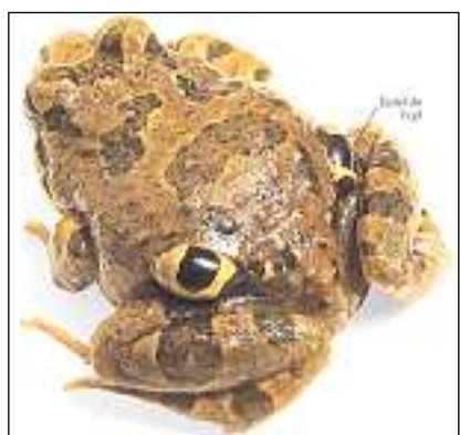
Il rustg da quatter egls dal Chile sa senta smanatschà.