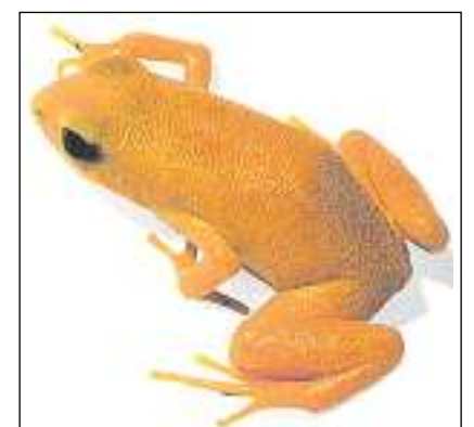
La raunetta dorada oranscha dal Madagascar è periclitada.