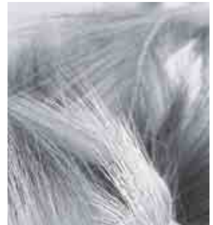
Pails chaura e ...