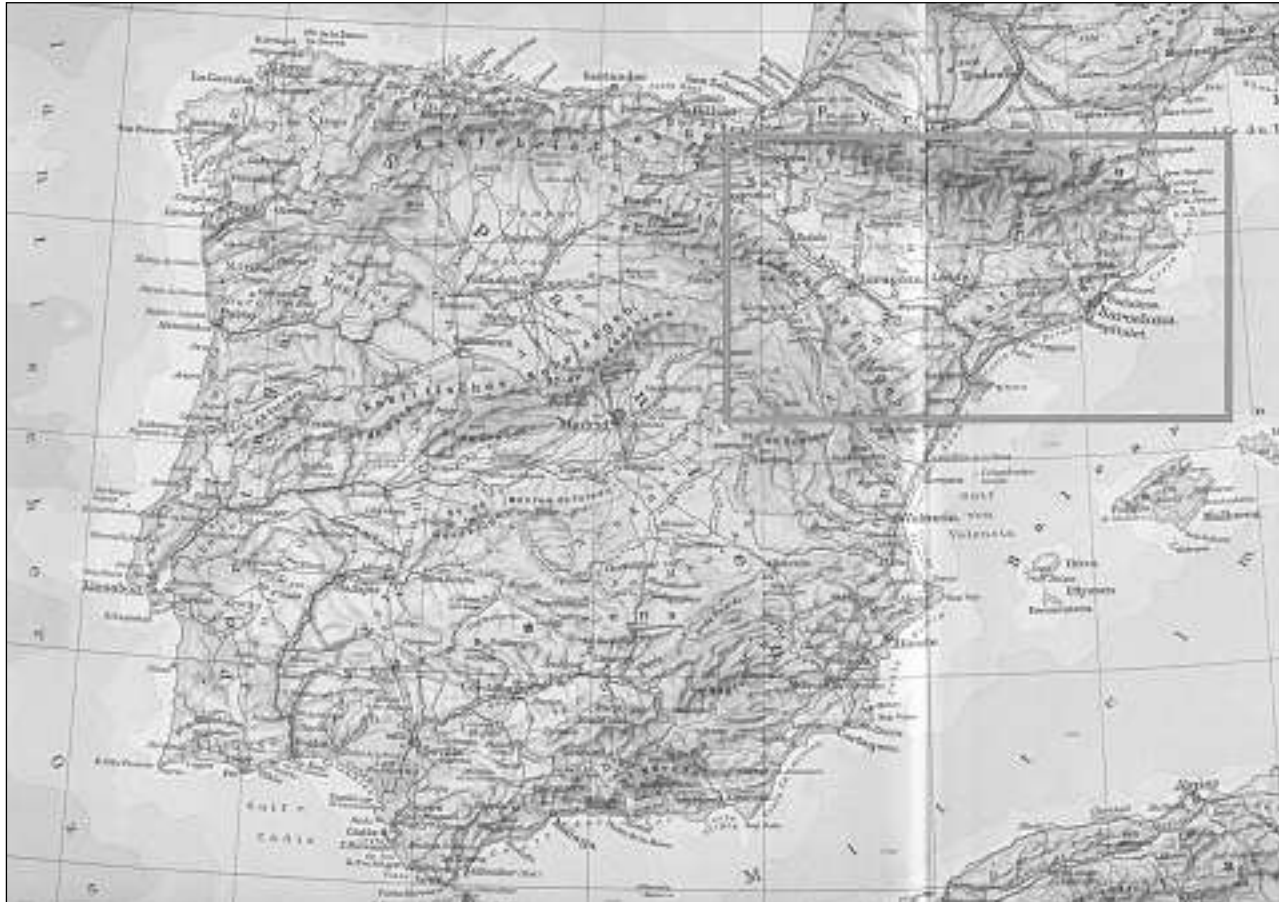
Il catalan n'è betg in dialect dal spagnol, mabain in linguatg tut agen dapi blers tschientaners.

«La Catalugna fa politicamain part da Spagna, ma s'enclegia sasezza sco atgna naziu (...)». Il catalan n'è tuttina betg in dialect dal spagnol, mabain pelvair in linguatg tut agen dapi blers tschientaners. Sco il spagnol, atgnamain «castiglian», è il catalan naschi ord il latin pledda, ma sumeglia dapli al provenzal [u occitan] (...). En il davos decenni è l'influenza dal catalan [en Catalugna] anc creschida, entant ch'il spagnol è vegni tschessent vinavant (...). Cuntunt per ils numerus turists ha la regenza catalana ed in pitschen «Sprachführer Deutsch-Katalanisch» ch'ins po survegnir gratuitamain en ils uffizis turistics» (pp. 21–23). Il guid cuntegna plis glossars trilinghs che palesan las divergenzas tranter il vocabular catalan ed il spagnol. Davart ils transports publics (p. 67) stattan ils pers «disabte» e «sábado» («sonda»), «estiu» e «verano» («stad»), «tancat» e «cerrado» («serrà»), davart la cuschina (pp. 82, 84 e 87) «olives» ed «aceitunas», «formatge» e «queso», «amanida» ed «ensalada», «porc» e «cerdo», «fetge» ed «hígado» («gnirom, dir»). La persuna che ha controllà las bandieras dal guid na saveva betg catalan, ma ils plis sbagls ch'ella ha survej nota mo tgi ch'enconuscha la lingua. Lur anc ina surpraisa per tgi che ha gugent ils linguatgs «pitschens». En il chantun nordvest da Catalunya, davos il parc nazional, è situada la Val d'Aran, cun la funtauna ed il curs sura da la Garona, il flum da Toulouse. Là, sco en la regiun franzosa limitrofa da «Midi-Pyré-