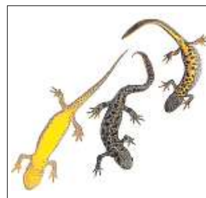
La piutscha è derasada bunamain en l'entira Europa.