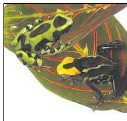
Las raunettas da tissi han colurs traglischantas. Il tissi sa chatta en lur pel.