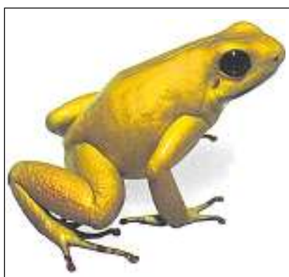
La rauna la pli tissientada dal mund è la «rampignadra terribla da feglia».