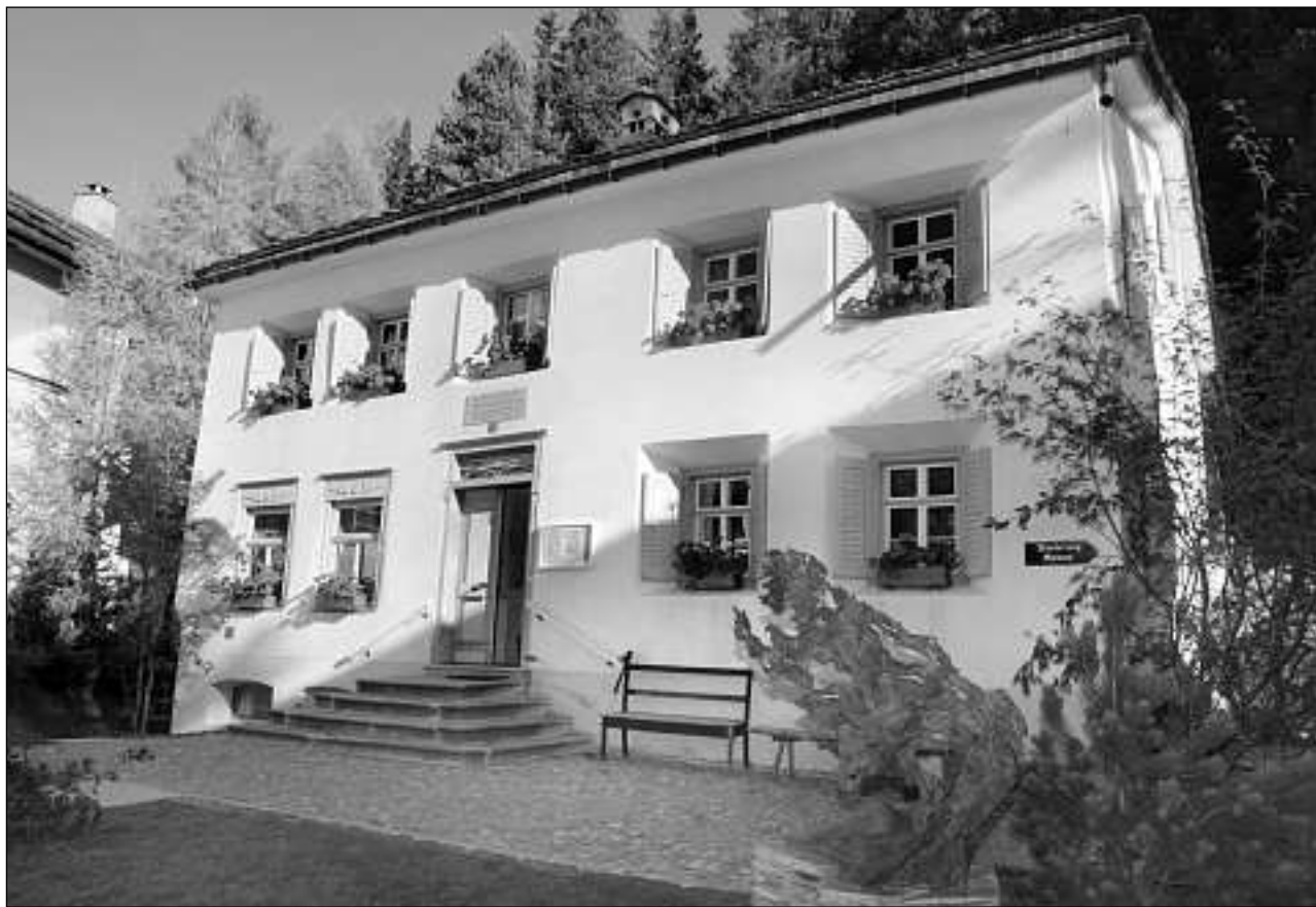
Sco viandant senza paus ha Nietzsche era passentà la stad en la «Chasa Nietzsche» a Segli en Engiadina.

La cuntraforza da quest princip apollinic e dionisic è per Nietzsche il patratgar da Sokrates, en il qual el vesa l'entschatta d'ina raziunalitad nunreala. Tenor las enconuschientschas da Nietzsche ha dapi lura in patratgar raziunal nunpratic manà, sur Platon, l'entira filosofia europeica en in'unica gronda via pulaina. Questa via pulaina spiertala consista en il fatg che la tradiziun cristian-antica ha empruvà da metter la virtid e la ventira sin il medem nivel sco il giudizi. Cun ses princip dionisic vuleva Nietzsche responder cun in nov concept da la vita e da l'istorgia. I cumparan in suenter l'auter ses cudeschs filosofics e litterars che s'emplan ad ina da las ovras las pli genialas da l'istorgia umana. Quella cumpiglia per numnar mo intginas da las pli impurtantas scrittiras: Unzeitgemässe Betrachtungen , Menschliches-Allzumenschliches , Morgenröte , Die fröhliche