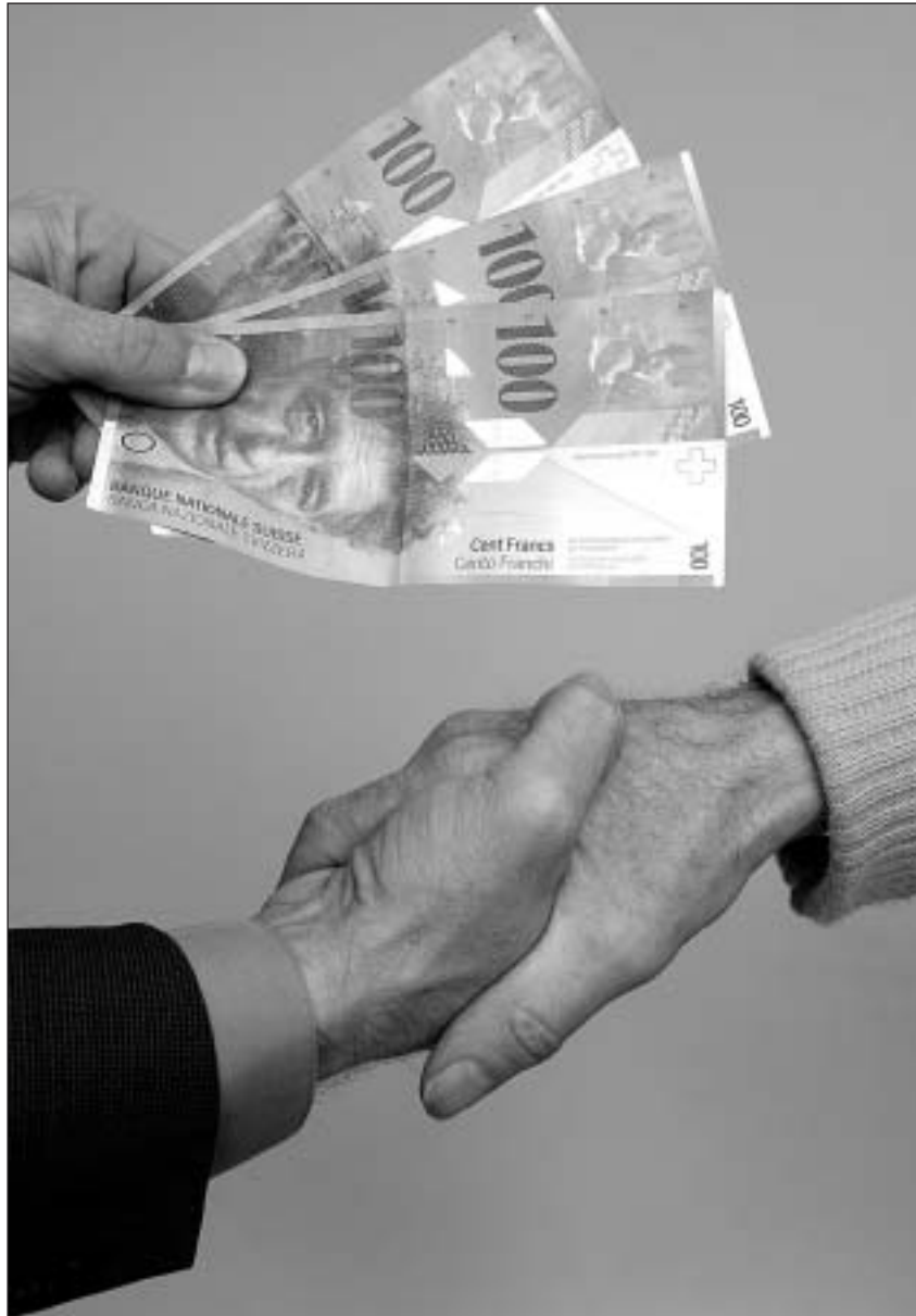
Blers na san betg, sche l'atgna paja è abundanta u memia bassa. Ma uss datti in quinta-paja.